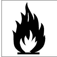
Zeer licht ontvlambaar